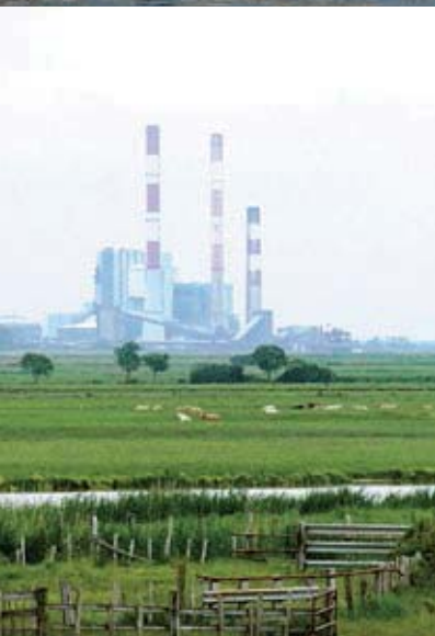
Marais estuariens, pâturage extensif et centrale thermique de Cordemais (44)