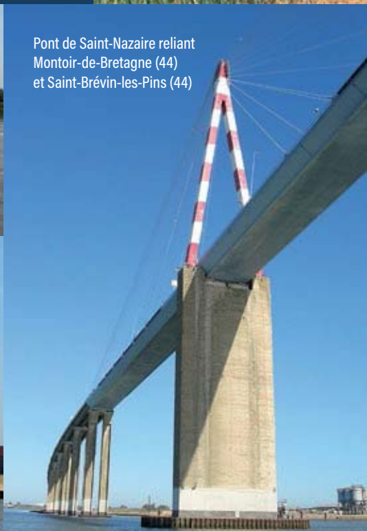
Pont de Saint-Nazaire reliant Montoir-de-Bretagne (44) et Saint-Brévin-les-Pins (44)