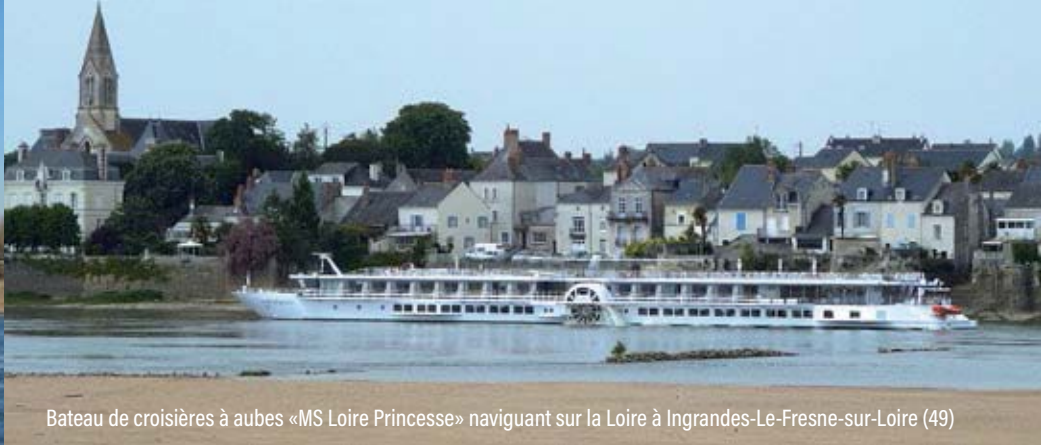
Bateau de croisières à aubes «MS Loire Princesse» naviguant sur la Loire à Ingrandes-Le-Fresne-sur-Loire (49)