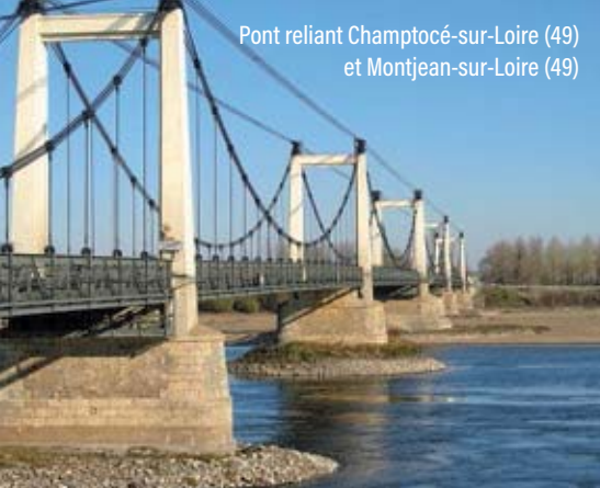
Pont reliant Champtocé-sur-Loire (49) et Montjean-sur-Loire (49)