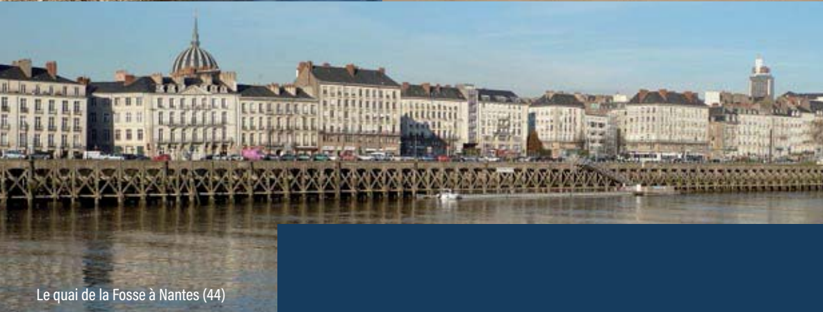
Le quai de la Fosse à Nantes (44)