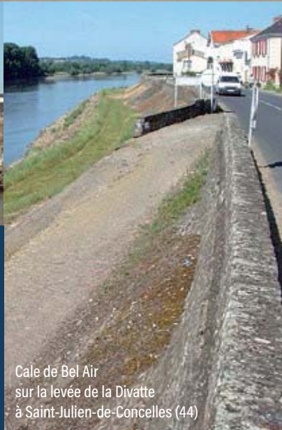
Cale de Bel Air sur la levée de la Divatte à Saint-Julien-de-Concelles (44)